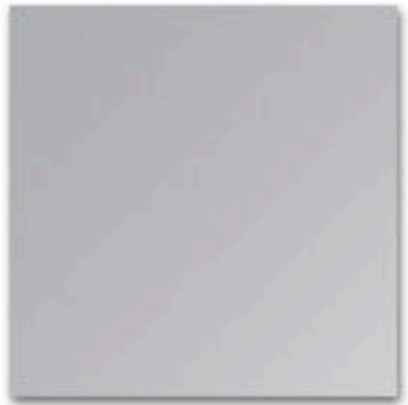
01 hoogglans chroom