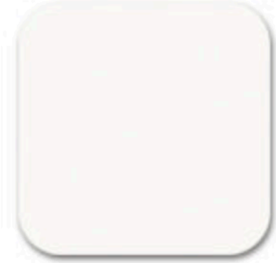
52 soft light