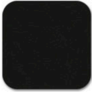
01 basic dark