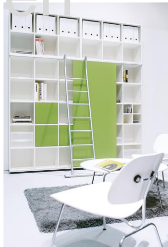
Open vakken systeemkast